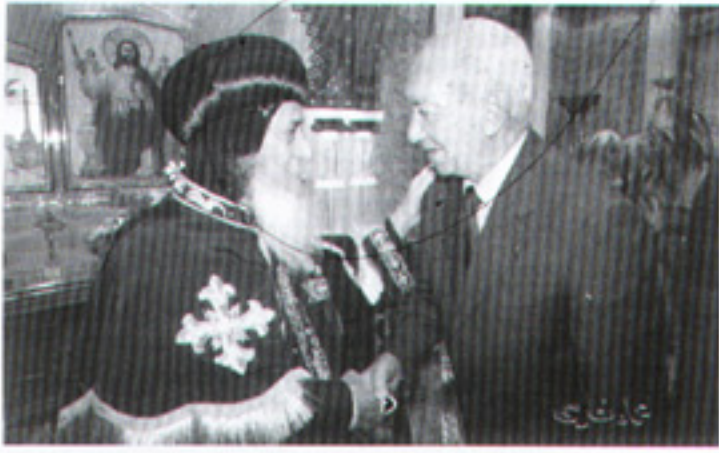
مع اللواء عبد السلام المحجوب وزير التنمية المحلية