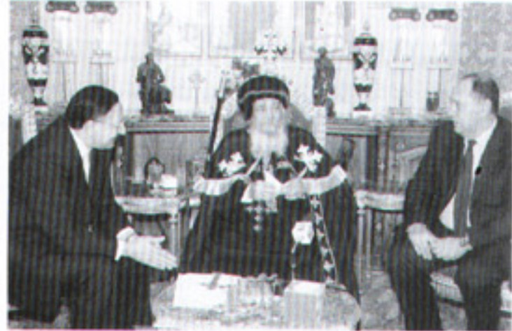
مع د. ماجد جورج وزير البيئة وأ. زهير جرانة وزير السياحة