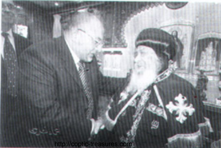
مع الشيخ خالد الجندى الداعية الإسلامى