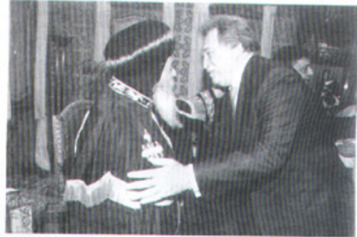
مع الأستاذ محمود أباطة رئيس حزب الوفد