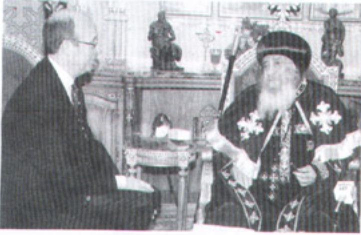
مع سفير بريطانيا بمصر