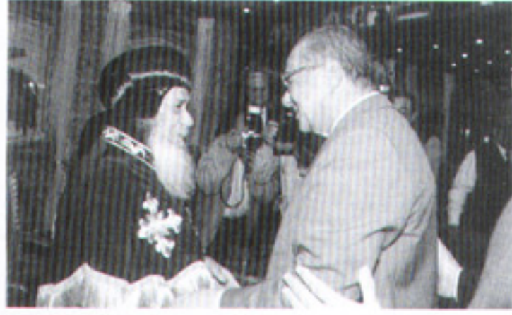
مع الدكتور حمدي زقزوق وزير الأوقاف