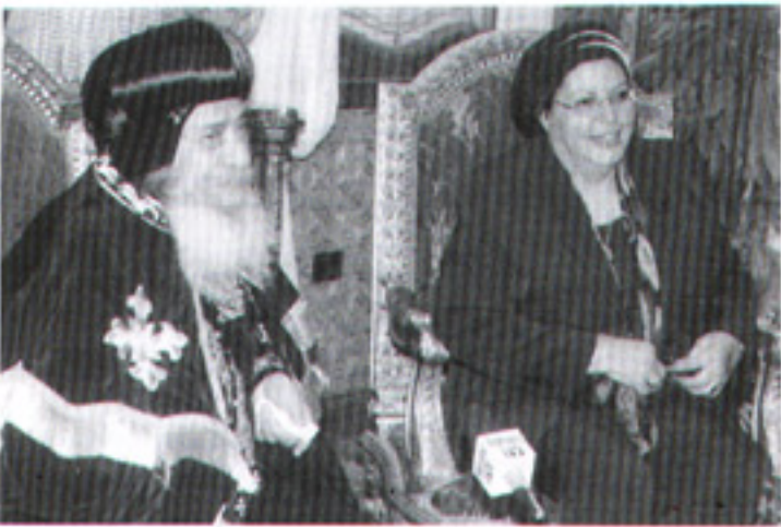
مع السيدة عائشة عبد الهادى وزيرة القوى العاملة