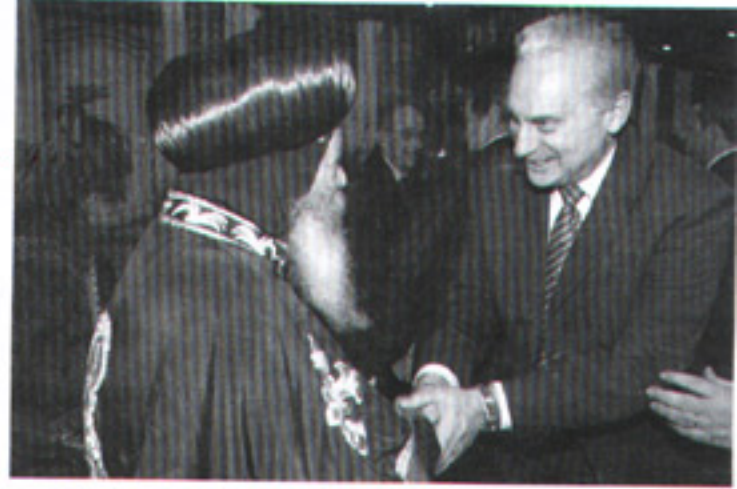
مع السفير الأمريكى بمصر