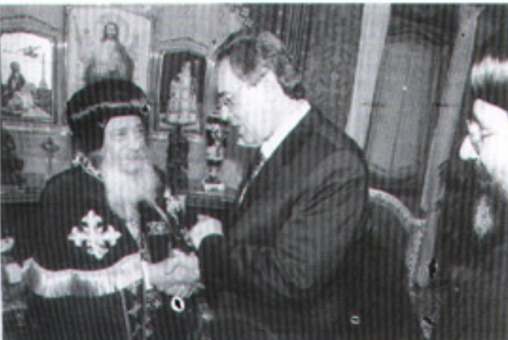
مع المستشار عدلى المستشار عدلى