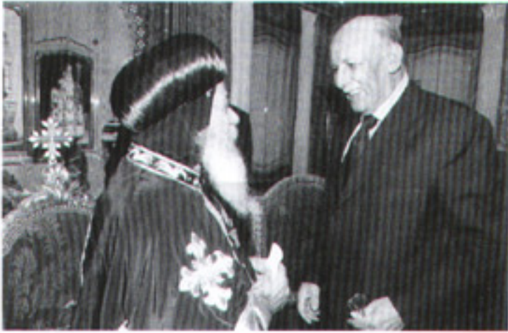
مع الدكتور أحمد العمادى وزير القوى العاملة السابق