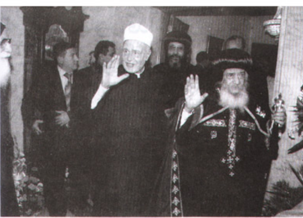
البابا فى توديع فضيلة شيخ الجامع الأزهر فى المقر البابوى

كليفلاند للسؤال عنا من بلاد عديدة من أمريكا،