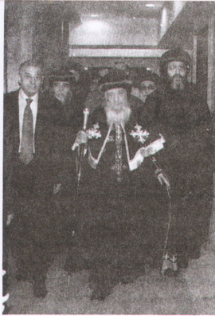
البابا في مطار القاهرة عند عودته

توجه قداسته بعد ذلك إلى البطريركية، التي كانت مكتظة تماماً بالكثير من أفراد الشعب وفرق الشباب للترغيب والترغيب.. استقبل قداسته البابا بنموذج الفرح وهتاف التهنيل وترانيم الشكر والفرح. الرب يديم لنا حياة وقيام أبينا الطوبوي المكرم البابا المعظم الأنبا شنودة الثالث، ويحفظ لنا صحة قداسته الغالية سنين كثيرة ولزمنة سالمة هادئة مديدة.