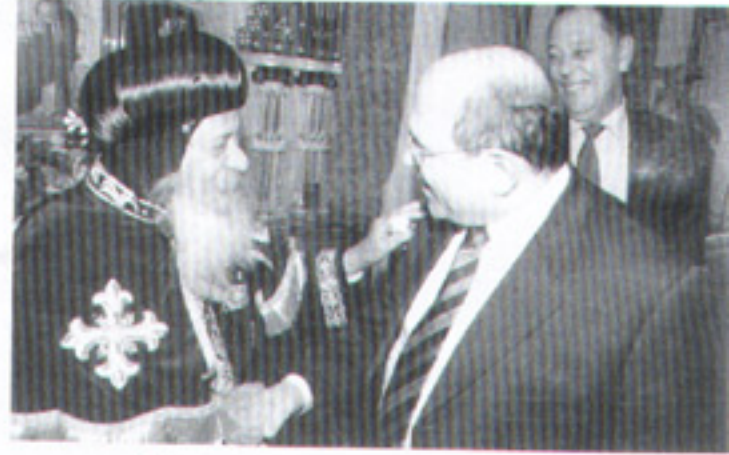
مع الدكتور مصطفى الفقى عضو مجلس الشعب