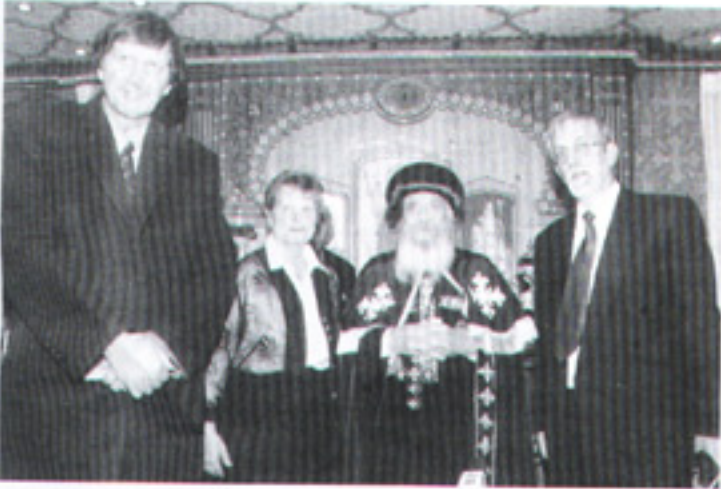
مع زوجة البروفسور Auto Minardos