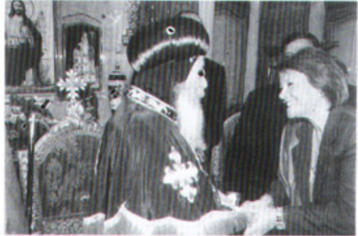
مع د. فائزة أبو النجا وزيرة التعاون الدولي